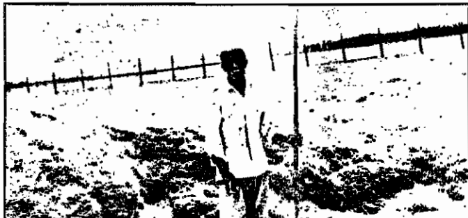
مالکان روستای شمس آباد دور زمین هارا از ده کشتی کرده اند، تا از اجرای عدالت و مصون، پمان با اجرای قانون، حق را به حق دار برسانید و نرده های ظلم و استثمار را برچینید.

۷ نفر از خوش نشینان این روستا، بعد از پیروزی انقلاب، به دفعات کوشیده اند تا تعدادی از زمین های مالکان را در اختیار گرفته و روی آنها کشت کنند. ولی تاکنون بر اثر قدرت نامی مالکان و مساعدت آن ها نتوانسته اند موفق به معادله زمین ها شوند. خوش نشینان، با انتخاب یک شورای سمنه (که یکی از آنان از دهقانان کم زمین