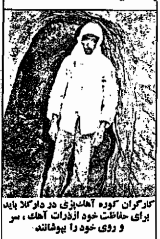
کارگران کوره آهک پزی در دار کلا باید برای حفاظت خود از ذرات آهک، سر و روی خود را پویشاند