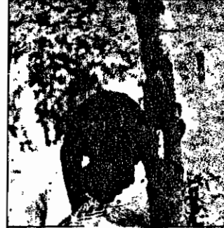
پارک آزادی شیراز - کارگر جوانی که از فرط خستگی به سایه درخت پناه برده است، از کوشش چرم می‌آید، ولی مجبور است کار کند.

شورای کارکنان پالایشگاه تهران در اعلامیه‌ای می‌نویسد: "مزدوران بحث عراق و نوکران سر سپرده امپریالیسم آمریکا حملات خود را علیه کشورمان گسترش داده‌اند. حملات و خشونت ارتش مزدور عراق به میهن ما برای چیست؟ انگیزه اینگونه شاه‌جات چیست؟ آنچه مسلم است ارتش عراق تحت رهبری سدا حسین کثیف و با کمک آمریکا جنایتکار و قدرت‌تسلطی حتی یک وجب از خاک ایران را ندارند و قدر مسلم هدفش از این باغیگری‌ها و وحشیگری‌ها تقویت فد انقلاب در داخل می‌باشد. آیا این گونه اعمال جز به نفع آمریکا و مزدوران داخلی‌اش تمام می‌شود؟ آیا جز به نفع سلطنت طلبانی چون بختیار اویسی، پالیزیان، ساوکی‌ها