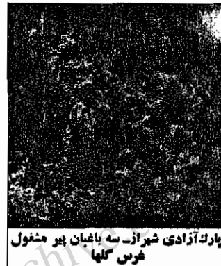
پارک آزادی شیراز سه باغبان پیر مشغول غرس گلها

ما در این پارک سه نفر مسئول هستیم. آن‌ها در قلم تا بستان اغلب از ساعت چهار و پنج تا با زده شب، یک سوه کار می‌کنند (یعنی بیش از نوزده ساعت)، یکی از کارگران، درحالی که علاقه‌مندی‌های از چهارهشت هویدا است، می‌گوید: در پارک آزادی حدود چهل نفر به شغل باغبانی اشتغال دارند، که بیشتر آنها از زمان افتتاح پارک در این جا کار می‌کنند. در میان آنها کارگرانی یافت می‌شوند که بیش از هشت سال سن دارند. این کارگران باید تا آخر عمر کار کنند، زیرا حقوق ناچیز و زشتی، به هیچ وجه کفاف زندگی آنها را نمی‌دهد. یکی از کارگران باغبان، درحالی که از کوشش چرم می‌اند و به علت ضعف روی خاک و گل ولای زبردستی دراز کشیده بود، گفت: