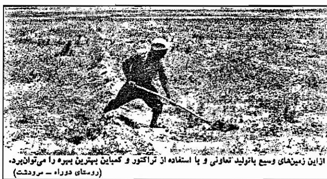
از این زمین‌های وسیع با تولید تعاونی و با استفاده از تراکتور و کمباین بهترین بهره‌وری می‌توان برد. (روستای دوراه - سرودت)

روستای دوراه ۶۰ کیلومتری سرودت قرار دارد. در این ده ۱۶ خانوار زندگی میکنند که هیچک از خود زمینی ندارند. زمینهای این روستا در حال حاضر ۱۲۵ هکتار است. که مالک تعلق دارد. از خرما و زاده روستای دوراه، یک یادبفر سر روی اراضی مالک کار میکنند و از محصول ۳۰ درصد بدانشان می‌رسد. که اسامی بعلت آفت سهم دهقانان کثرت شده است.