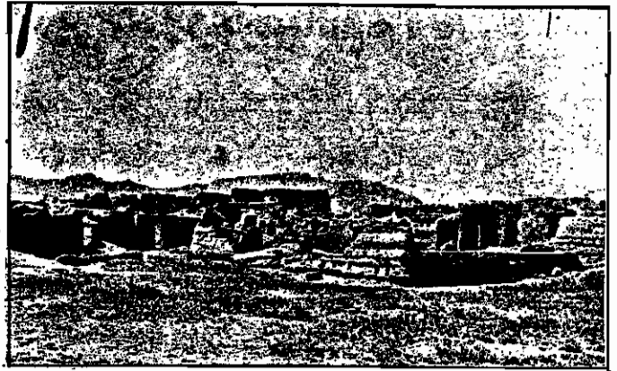
گذری به روستا