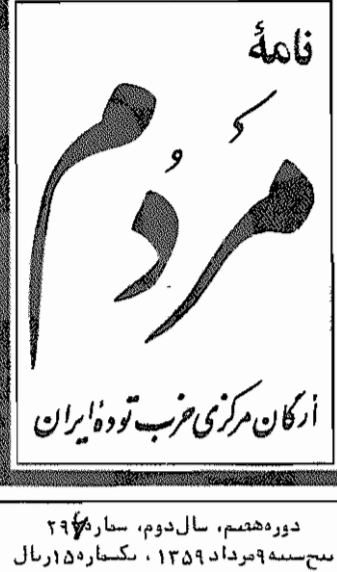
دوره هفتم، سال دوم، شماره ۲۹ مهرماه ۱۳۵۹، شماره ۱۵۸