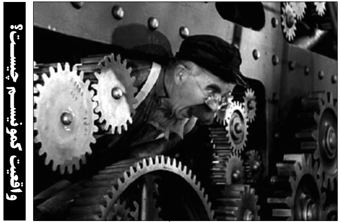
واقعیت کمونیسم چیست؟