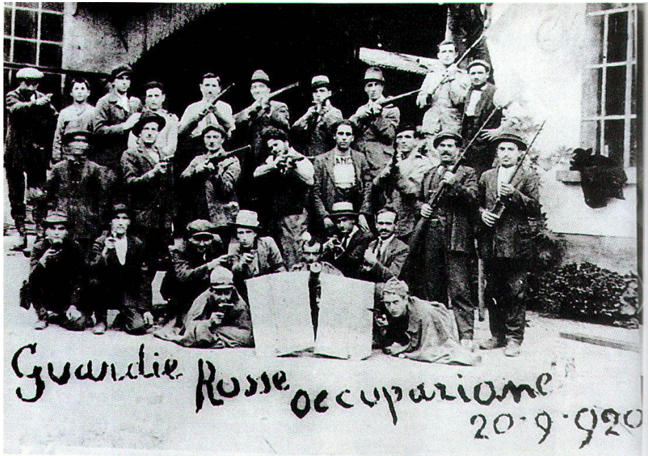
«گاردهای سرخ» ایتالیا، ۲۰ سپتامبر ۱۹۲۰

و گرامشی در پی آن بود که آن را بیشتر شرح و بسط دهد، بازماندند. رهبری مؤثر بوردیگا در حزب با ضربه خوردن دستگاه حزبی که اعضای آن را با ۸۰ درصد کاهش به ۵۰۰۰ نفر رسانید، پایان یافت.» (صفحه ۴ مقدمه)