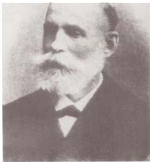
پدر تروتسکی: داوید برونشتاین