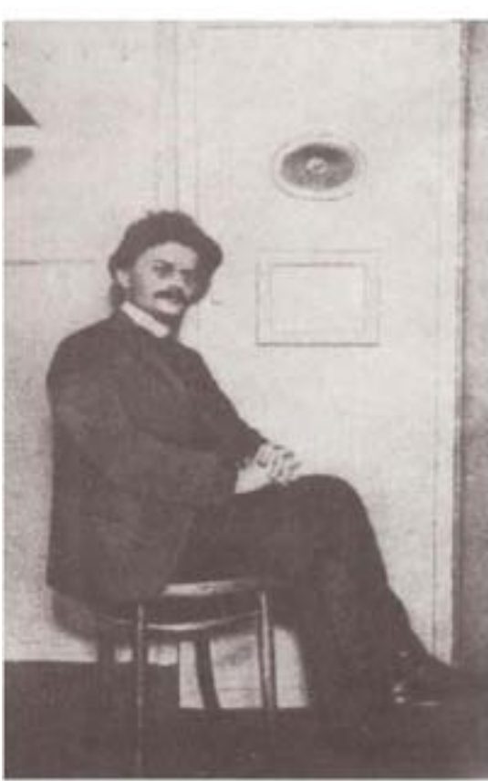
تروتسکی در زندان انفرادی تزاری قبل از محاکمه