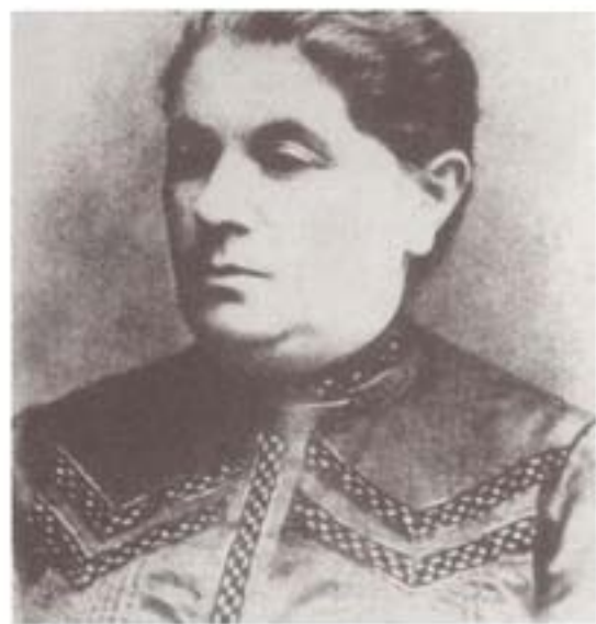
مادر تروتسکی: آنا برونشتاین