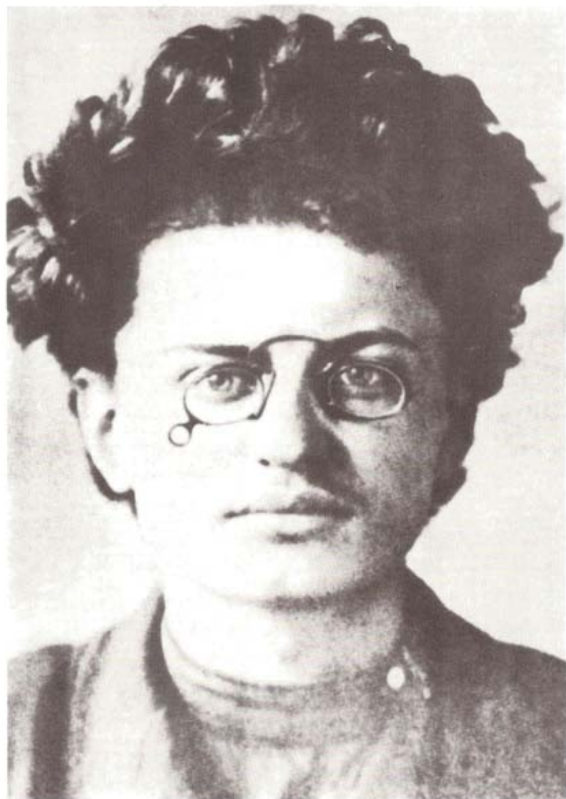
تروتسکی در بیست سالگی