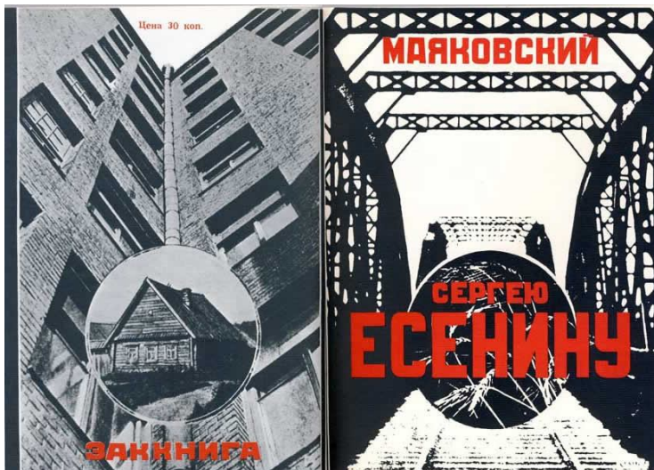
جلد کتاب به "سرگئی یسنین" مایاکوفسکی - طرح از الکساندر داوژنکو

تو رفته ای آنطور که می گویند، به دنیای دیگری. پوچی... پر می کشی، در کهکشان تردید. نه مساعده و