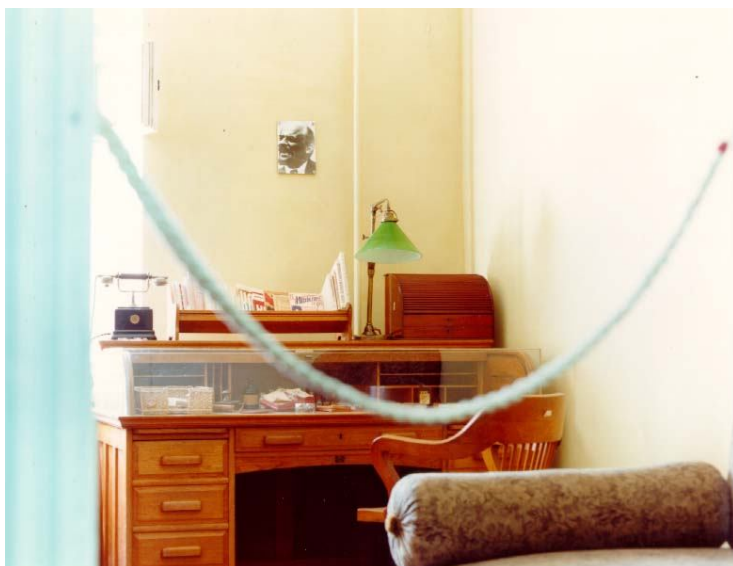
اتاق خواب و میز کار شاعر - موزه مایاکوفسکی / مسکو

گردباد حوادث در گرهگاه وظایف انبوه، روز پاورچین فرو می رود که تیرگی شب در میرسد دو نفر در اتاق: