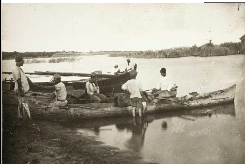
ماهیگیران دوره ی قاجار

به دنبال آن اهالی رشت هم به یاری صیادان انزلی برخاستند و موضوع تحریم امتعه روسی را عنوان کردند. این امر باعث سرعت عمل در رسیدگی به کار اعتصابیون شد و نتیجه این که به وسیله حکومت رشت مزد صیادان افزایش یافت. ماهیگیران از بابت مزد خود تا یک درجه راضی شدند. هر چند به واسطه پیش آمدن استبداد صغیر، در آن زمان حق صیادان اعتصابی انزلی پرداخت نشد، اما همین تحرک اجتماعی در گیلان از جمله حرکت های در جهت مشروطیت بود.»