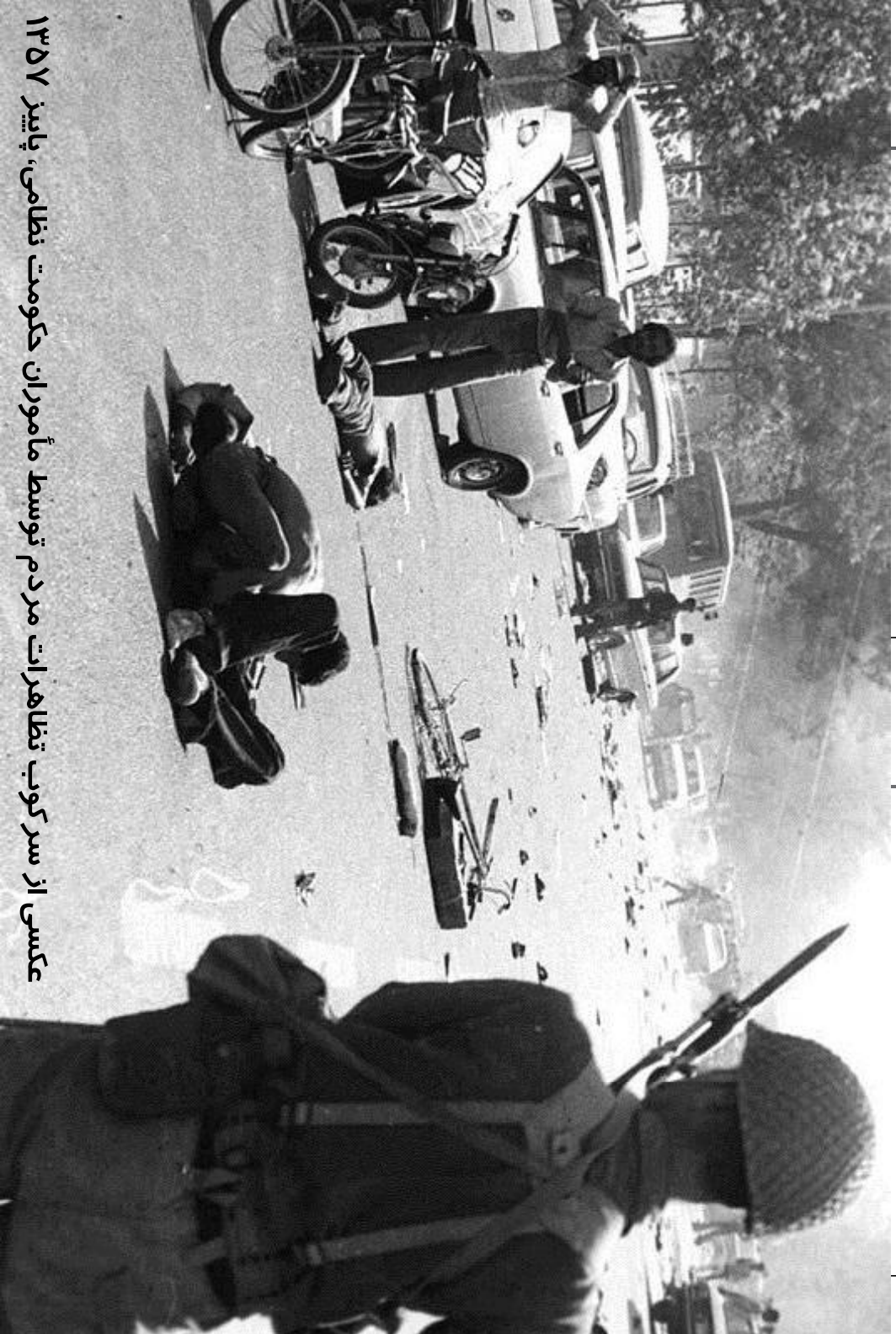
عکسی از سرکوب تظاهرات مردم توسط مأموران، پاییز ۱۳۵۷