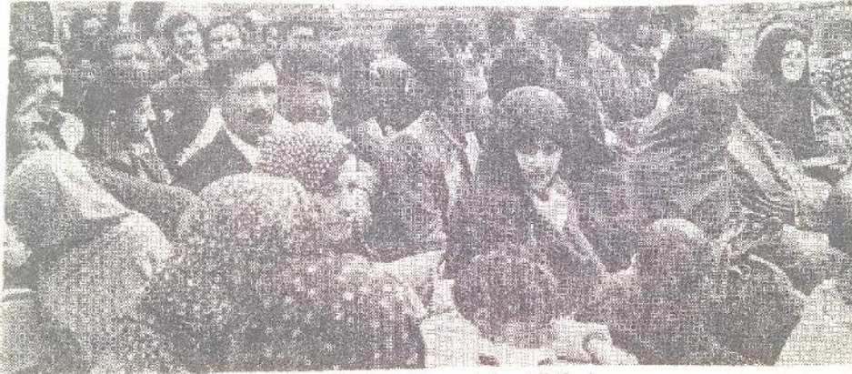
در میان کارگران بیکار ، تعدادی کارگزین شده می‌شود

نامه‌ی سرگشاده‌ی کارگران بیکار به آیت‌الله طالقانی و نخست وزیر