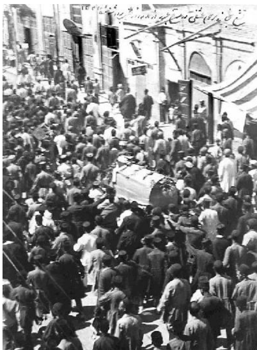
تشییع جنازه عشقی، تهران