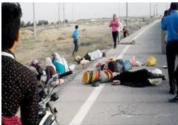
کشته شدن کارگر معترض معدنچو در تجمع اعتراضی