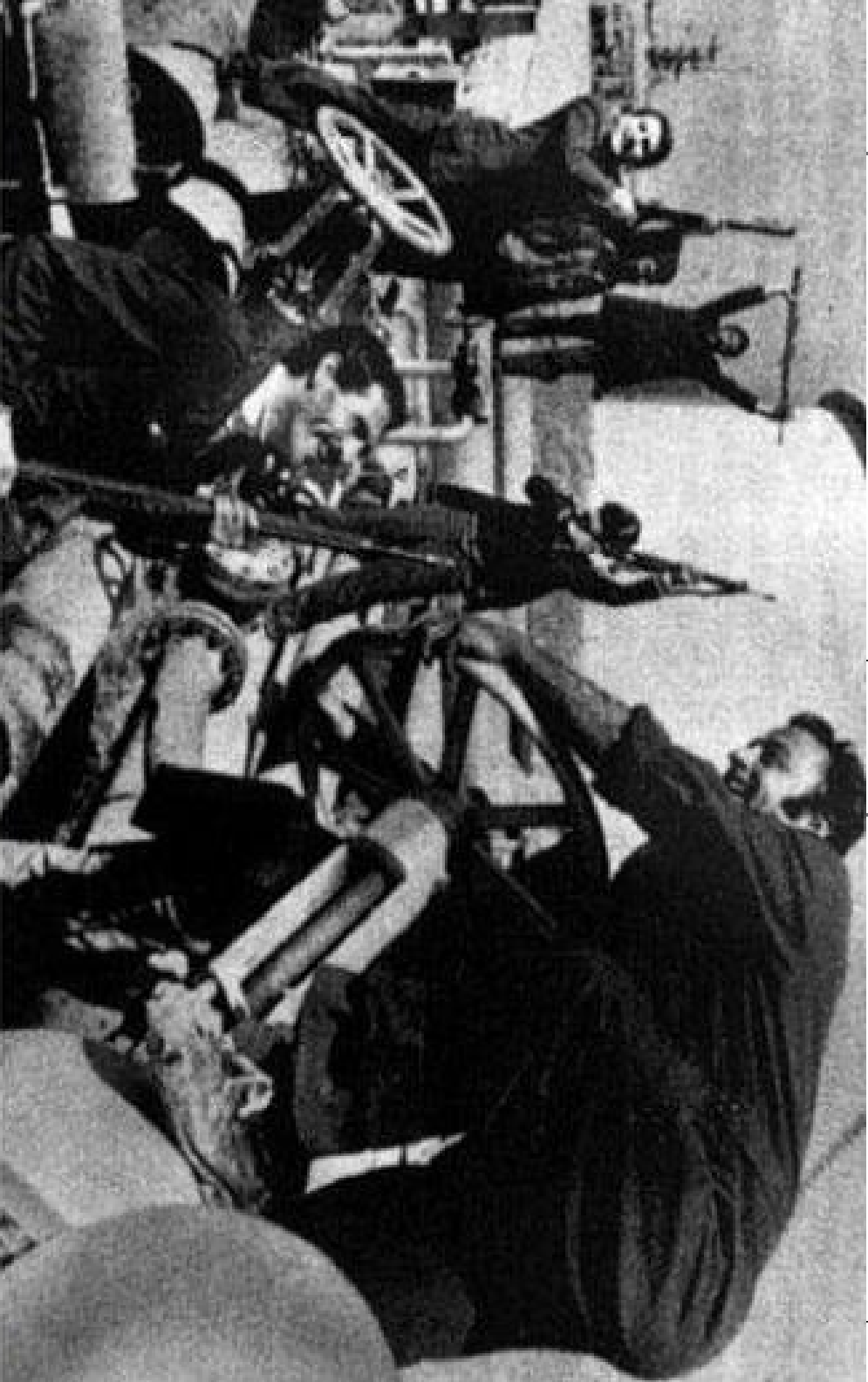
باز کردن شیرهای نفت پس از سرنگونی رژیم سلطنت، سال ۱۳۵۷