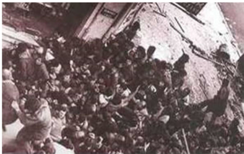
قتل عام کارگران ترکیه در اول ماه مه ۱۹۷۷ میدان تقسیم استانبول

http://www.globalresearch.ca/workplace-occupations-in-turkey-response-to-neoliberal-authoritarian-rule/5378667 -۳