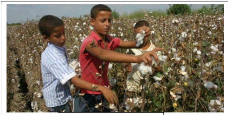
کودکان کار در مزارع پنبه ترکیه

۳- http://www.dol.gov/ilab/reports/child-labor/turkey.htm