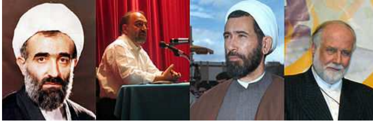
برخی از اعضای اولین ستاد انقلاب فرهنگی از راست به چپ: حسن حبیبی، محمود باهنر، عبدالکریم سروش و ربانی امینی

تا از تجمع در حول و حوش دانشگاه‌ها خودداری کنند و تاکید کرده بود که در صورت لزوم با یک پیام رادیویی از آن‌ها خواهد خواست به دانشگاه‌ها بروند. همچنین تاکید شده بود اگر امور بر خلاف نظر شورا جریان یابد، شورا و رییس‌جمهور منتظر پایان ضرب‌الاجل نمی‌شوند و به دانشگاه خواهند آمد.