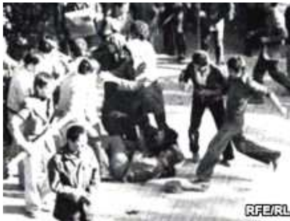
صحنه‌ای از یورش عوامل حکومتی به دانش‌جویان دانشگاه تهران

آغاز شد. بسته‌شدن دانشگاه‌ها باعث محروم شدن شمار بزرگی از دانش‌جویان از ادامه تحصیل و اساتید دانشگاه‌ها از تدریس شد. بدین ترتیب، پس از بازگشایی دانشگاه‌ها، همه تشکلهای دانشجویی منحل و فعالین آن‌ها اخراج، زندانی و یا اعدام و یا این که موفق به فرار شده بودند. همچنین این امر باعث انحلال شوراهای صنفی، کتابخانه‌های دانشجویی و از بین رفتن دفاتر و جریانات سیاسی دانشجویی شد و هیچ تشکل دانشجویی به جز انجمن‌های اسلامی وابسته به دفتر تحکیم وحدت در دانشگاه‌ها اجازه فعالیت نداشتند.