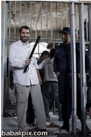
مسعود ده نمکی در حمله به کوی دانشگاه تهران

چون بهرام بیضایی، به دلیل تهدیدها و فشارهای مامورین امنیتی و مسئولین سینمایی مجبور به ترک کشور شده است.