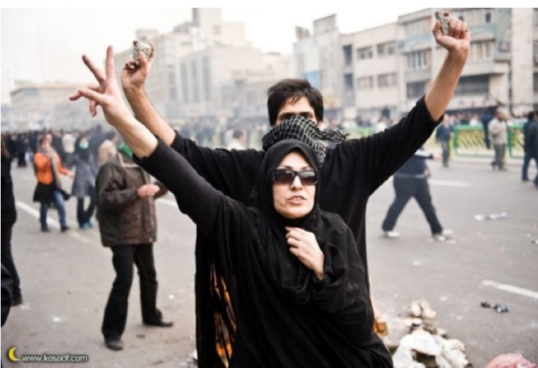
تصویری از راهپیمایی‌های سال 1388

جنبش دانشجویی نیز همچون سایر جنبش‌های سیاسی، اجتماعی و فرهنگی، دارای گرایش‌های سیاسی-طبقاتی گوناگونی است. و صف‌بندی‌ها و گروه‌بندی‌های سیاسی-طبقاتی، تحلیل‌ها و روایت‌های نظری و افق و چشم‌انداز خود را از وقایع و تحولات جنبش دانشجویی دارند.