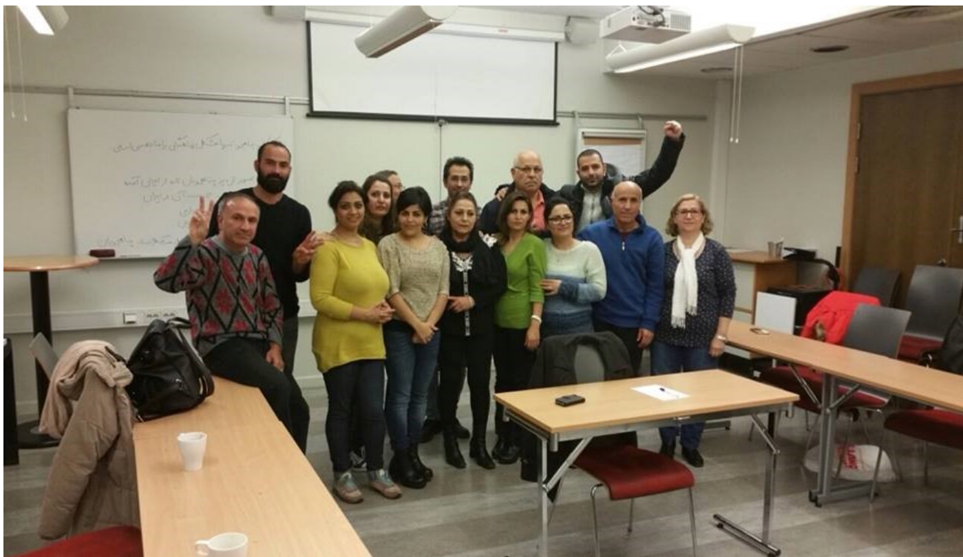
ژوئن ۲۰۱۵ - استکهلم