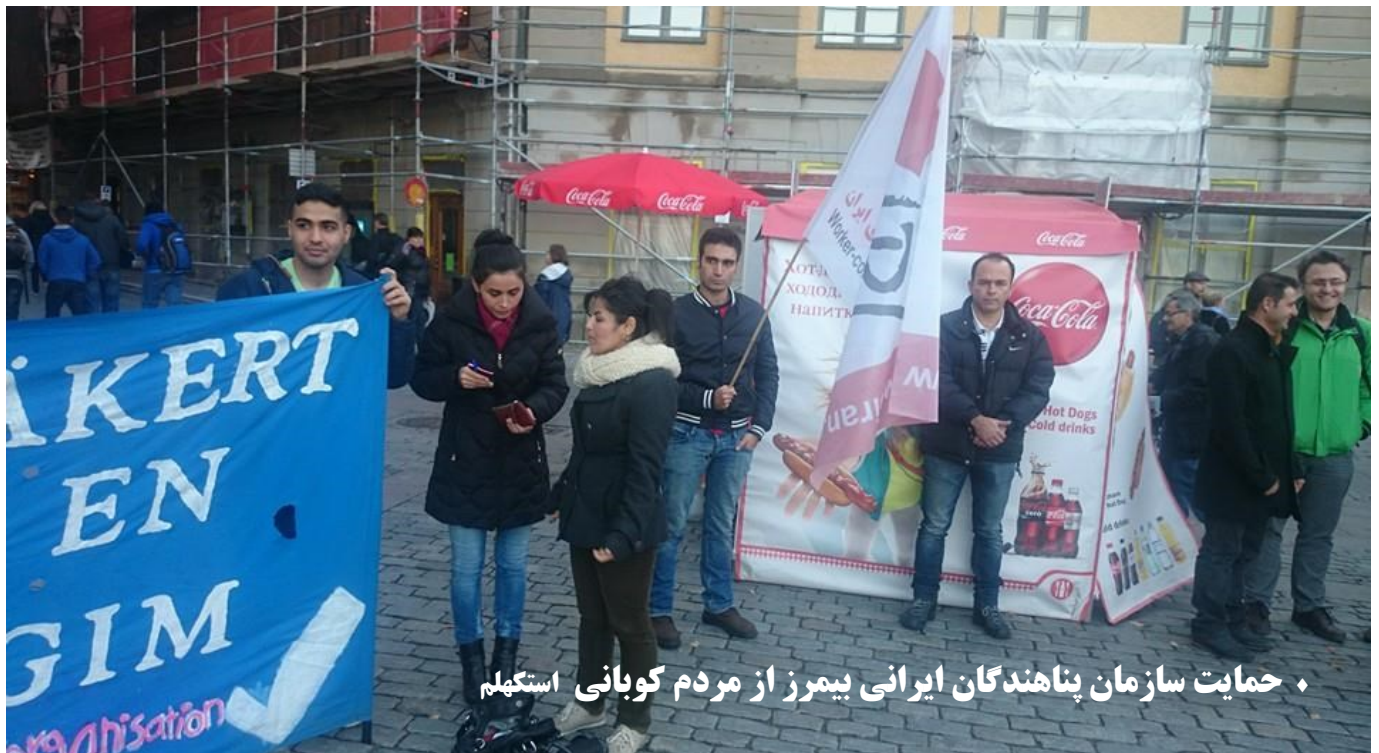
♦ حمایت سازمان پناهندگان ایرانی بیمرز از مردم کوبانی استکھلم