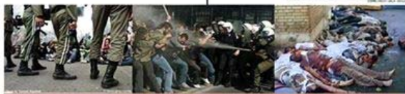
مرکز پیگرد سزان رژیم اسلامی به جرم جنایت علیه مردم ایران!