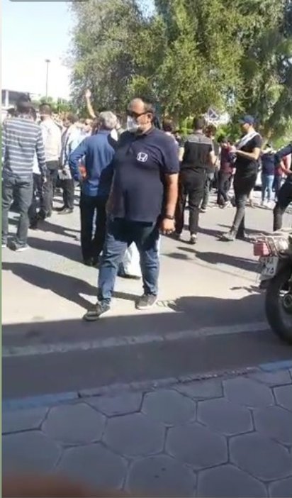
تجمع اعتراضی کارگران نیشکر هفت تپه جلوی فرمانداری شوش.