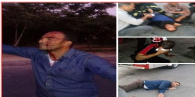
حمله وحشیانه به کارگران هیکو، اراک میکومر است.

حمله نیروهای ضد شورش بعد از ساعت ۱۸ روز ۲۵ شهریور ۹۸ متأسفانه بدلیل حمله با سنگ و باتوم و گاز اشک آور به کارگران هیکو کلیتاً دقیقاً عمق فاجعه را نشان نمیدهد.