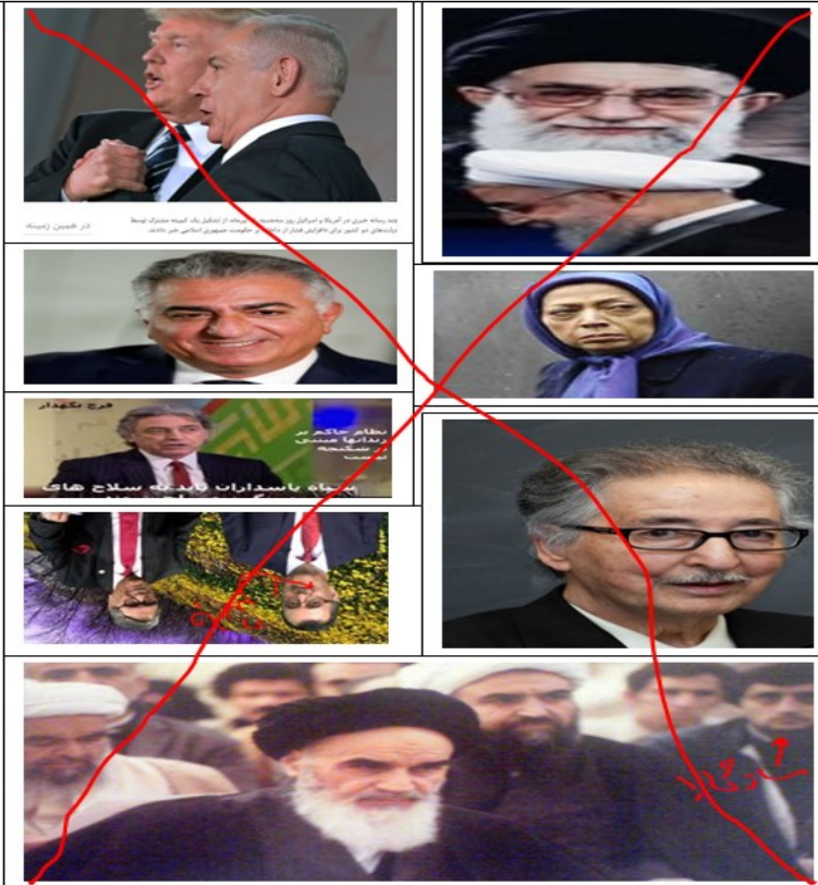
نخستین گام در راه رهایی واقعی، عبور از همه این مرتجعین و دیگر همپالگی های اینها است!

پیروزی ما در گروه عبور از همه این دولتها و استراتژی ها و امیدهای واهی و یوچ و تنها با اتکا به صف و سیاست مستقل و سوسیالیستی خودمان است! همه را به این صف و تلاش فرامیخوانیم.