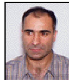
اقبال نظر گاهی

ببندها و حکومت نظامی و ملیشایی سیاه، ساعات تلخ و پر اضطرابی برای فاشیستها رقم زد. حضور پرشکوه مردم و تلاش برای تجمع مرتبا با واکنش سرکوبگران روبرو میشد: شلیک گاز اشک آور در امیرآباد و میر داماد، استفاده از گاز فلفل و اشک آور برای جلوگیری از پیوستن دانشجویان و مردم در خیابان ۱۶ آذر. فضای متشنج در میدان ونک و جمعیت