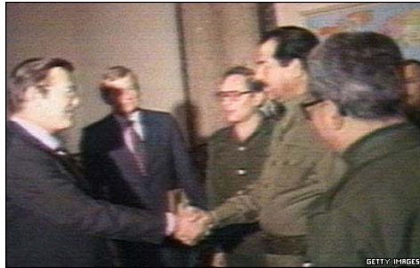
خوش آمد گویی صدام حسین به دونالد ترامپ

یکی دیگر از ادعاهای دولت آمریکا و هم پیمانانش این بود که گویا صدام را بخاطر ستمگری و بیرحمی هایش و همچنین زراد خانه شیمیایی اش سرنگون و اعدام کردند. متعاقب حمله نظامی به عراق و دستگیری صدام حسین و دیگر سران حزب بعث، پیام بخشش بوش ویلر از مردم جهان دایر بر عدم دست یابی به سلاحهای شیمیایی در عراق، پوچی این ادعا را بیش از هر چیز دیگری نمایان ساخت. با اعدام صدام نه تنها خشونت و انسان کشی در عراق پایان نخواهد یافت بلکه به تشدید و ایجاد تنشهای بیشتری دامن خواهد زد. تنها یک روز بعد از اعدام صدام حسین، نزدیک به نود نفر در اثر انفجار بمب در بغداد کشته شدند. حکومت صدام حسین همانند دیگر حکومتهای سرکوبگر منطقه، ساخته و پرداخته قدرتهایی بود که سرکوب و اعدام و اعمال ضد انسانی در آنها امری روزمره است. سرنگونی و اعدام صدام حسین هیچگونه ربطی به "عدالت خواهی" دولتمردان آمریکا و متحدینش در منطقه ندارد. بلکه امری کاملاً سیاسی و در خدمت اهداف آمریکا و هم پیمانانش در منطقه قرار دارد. دادگاهی صدام حسین بعنوان یکی از دیکتاتورهای تاریخ معاصر، فاقد کوچکترین عدالت و نرمهای دنیای امروز بود و با برپایی مضحکه ای بنام دادگاه صدام حسین و برای تسویه حسابهای سیاسی و قدرتی آمریکا در جهان و منطقه صورت گرفت. اگر حداقلی از محاکمه در یک دادگاه با نرمهای متعارف صورت می گرفت میبایستی بسیاری از سران و دست اندرکاران حکومتهای منطقه و سران دولت آمریکا نیز به محاکمه کشیده میشدند تا چهره