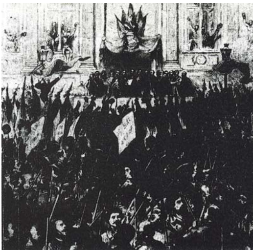
در تالار شهرداری اعلامیه کمون را می خوانند

" جریان عدالت را تامین کند." انتخاب دادرسان یکی از مهمترین خواسته های مردم بود و بویژه هنگام انتخابات کمون. طبق تصمیمات کمون قضاات انتخابی بودند و متهمین حق داشتند حضور شهودی را که برای دفاع از خود ضروری میدانستند بخرج کمون درخواست کنند. متهم حق داشت شخصاً وکیل برای دفاع از خود انتخاب کند. جلسات دادگاه عمومی بود و جرایم گزارش جریان آن را منتشر میکردند. رئیس دادگاه تنها برای یکبار انتخاب میشد. هیئت ژوری یا قضاوت توسط هیات منصفه که توسط ناپلئون اول منحل شده بود دوباره در دادگاههای کمون برقرار گردید. هرچند کمون و کمیسیون دادگستری وابسته به آن مجال آنرا نیافتند تا تصمیمات خود را در این باره به موقع اجرا بگذارند و موسسات قضائی مورد نظر خود را خلق کنند، با این وصف فقط کمون بود که توانست شکافی در دستگاه قضائی بورژوازی آن دوران پدید