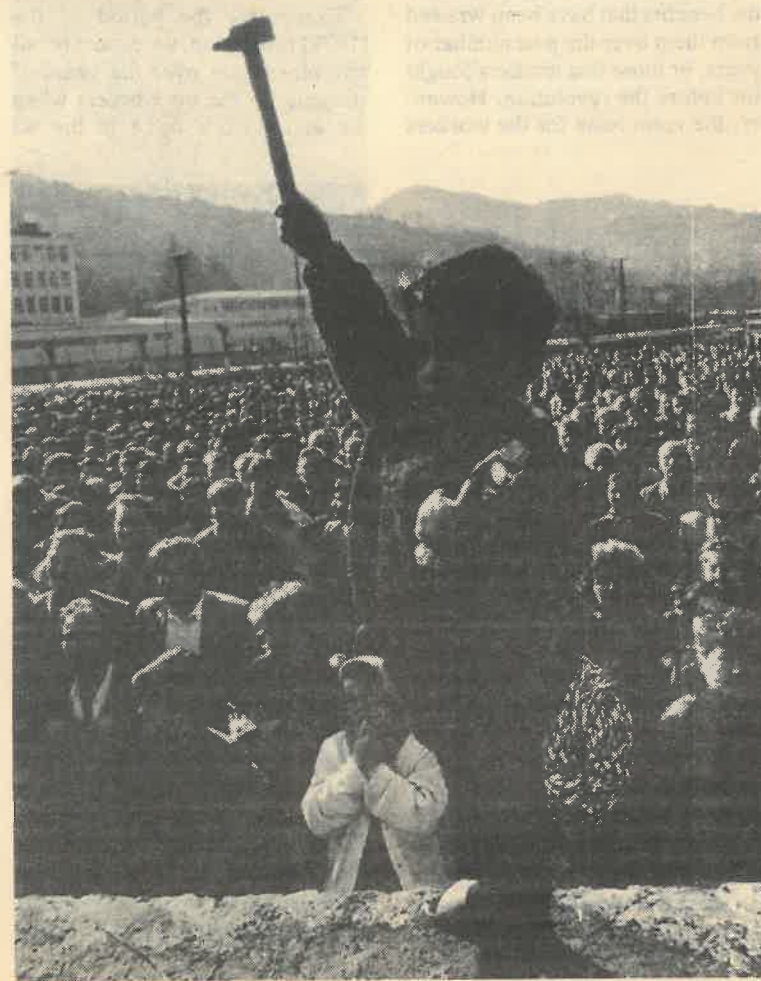
Miners' rally in the city of Zonguldak