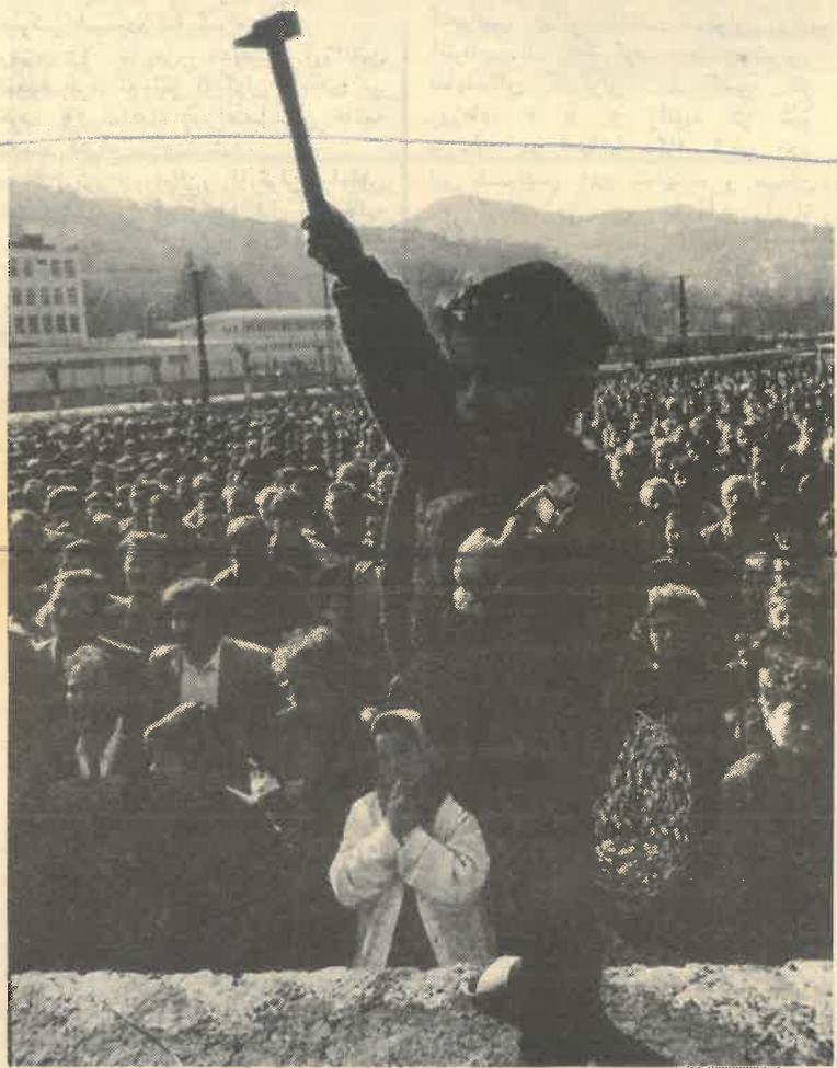
میتینگ کارگران ذوقولداق

* ک.ا: شرکت زنان در این اعتصاب بسیار چشمگیر بود، آنها چه نقشی داشتند؟