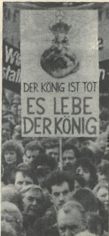
Demonstration in Berlin: 'The king is dead. Long live the king!'

Bizhan Behzadi, Worker Today correspondent in Germany, reports that the government's pretexts to justify the redundancies have become tiresome for the workers. Statements such as "Privatisation is proving too costly", "the eastern infrastructure is still too undeveloped for investment", "the old problems are many", etc., can't persuade the workers in eastern Germany to be more patient. They say: this is not the kind of unity we wanted or expected. However, the government bluntly claims that the crisis in eastern Germany is going to last longer than expected.