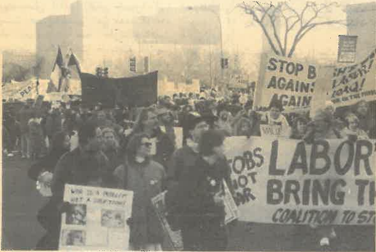
تظاهرات ضد جنگ در آمریکا

زیادی می کند، حداقل در بین توده کارگران سفید پوست این حمایت موجود است، ولی وقتی ویرانی ناشی از این جنگ بر ملا شود، وقتی اخبار جنایاتی که توسط بمبارانهای آمریکا و نیروهای دیگر ائتلافی بر علیه مردم عراق و کویت صورت گرفته رو شود و مردم از تلفات عظیم انسانی این جنگ کاملاً نامربوط به منافع کارگران مطلع شوند، علیه همه اینها عکس العملی صورت خواهد گرفت. این احساس شکل می گیرد، (در مورد جنگ ویتنام با تاخیر شاهد آن بودیم) که این سیاست و دولتی که آنرا پیش برد به هیچ وجه با منافع کارگران همخوانی ندارد. منظور این نیست که این عکس العملی است که در اکثریت شاهد آن خواهیم بود. اما از نظر دامنه و قدرت از آنچه در گذشته طولانی شاهدش بودیم، قویتر خواهد بود. من معتقدم در جنبش کارگری عناصری وجود دارند که از تجربه ویتنام، تجربه کار همبستگی با کشورهای آمریکای لاتین، و همینطور آفریقای جنوبی برخوردارند. وقتی مردم به خودشان بیایند و متوجه شوند که این نظم نوین جهانی تلاشی است برای آنکه همان نظم قبلی جهانی بردوام بماند، یعنی وضعیتی که سلطه کشورهای ثروتمند بر جمعیتی که ۸۰ درصد جمعیت جهان را تشکیل می دهد حفظ شود، در برابر آن عکس العملی نشان خواهند داد. زیرا بروشنی می توان دید که در این جنگ هیچ چیز وجود ندارد که سطح زندگی کارگر آمریکا یا چیز دیگری که مربوط به او یا کس دیگری شود را بهبود بخشد.