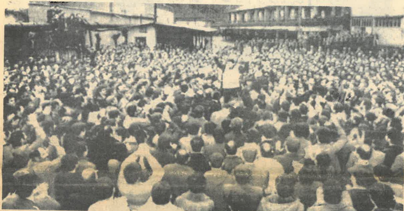
۳۰ نوامبر، متینگ معدنچیان ذوقولداق در اولین روز اعتصابی که حمایت مهلونی سایر کارگران و اقشار مردم را به دنبال داشت