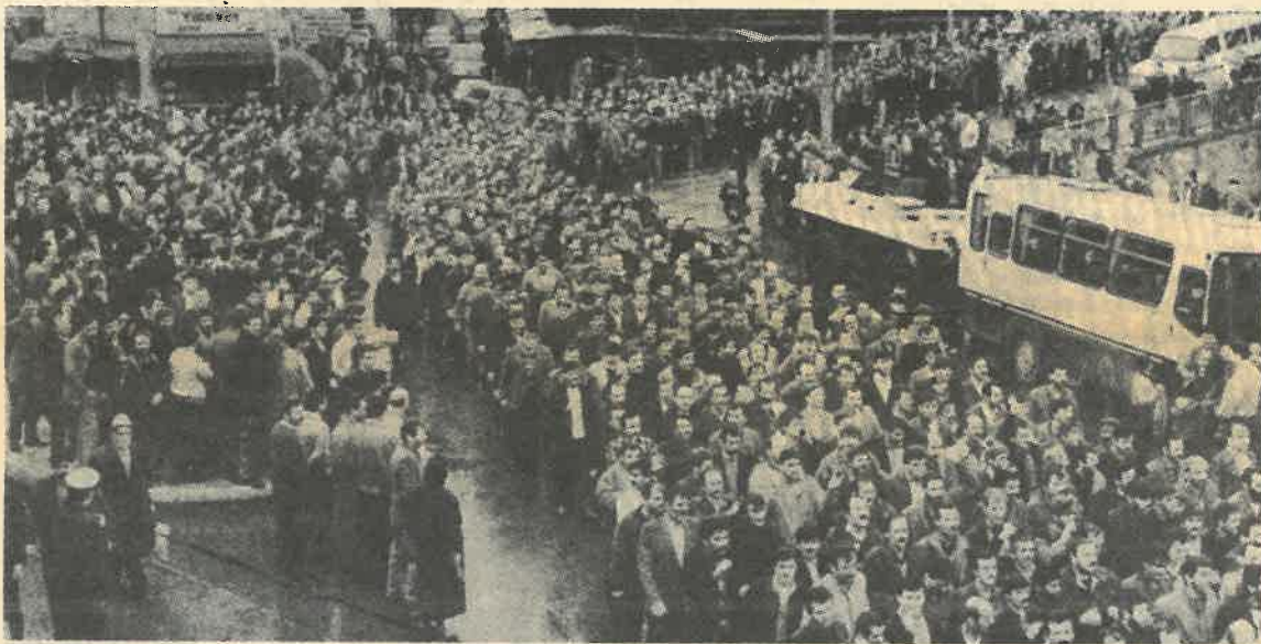
تظاهرات حدود ۲۰ هزار کارگر معدن در سوم دسامبر

مرکز خبری کارگران امروز: اعتصاب حدود ۵۰ هزار کارگر معادن شهر "زوتولدق" ترکیه که از ۳۰ نوامبر برای ۸۷۶ درصد افزایش دستمزد آغاز شده است با مبارزه برای استعفا "تورگوت اوزال"، علیه جنگ در خلیج فارس و سیاستهای ترکیه در قبال آن در هم آمیخته و حمایت فعال صدها هزار کارگر ترکیه را بخود جلب کرده است. این اعتصابات می رود تا پرونده اوضاع سیاسی دهه ۸۰ ترکیه که مهر کودتای خونین ۱۲ سپتامبر ۱۹۸۰ را بر خود داشت ببندد و آغازگر دهه ۹۰ با مهر جنبش کارگری باشد. به گزارش رضا شهرستانی گزارشگر کارگر امروز، اعتصاب معدنچیان بدنبال شکست مذاکرات اتحادیه کارگران و "هیئت معادن ذغال سنگ ترکیه" بر سر قراردادهای دسته جمعی آغاز شد از روز دوم مدارس شهر نیز در حمایت از معدنچیان تعطیل گشت. بنا به این گزارش از آغاز اعتصاب شهر "زوتولدق" شاهد تظاهرات و سخنرانیهای کارگران است و مردم شهر وسعا از آنها حمایت می کنند.