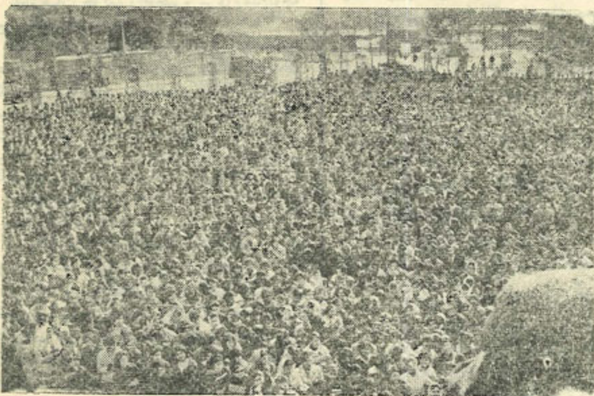
گوشه ای از اجتماع دانشجویان

امضاء کنندگان احتمالی این درخواست نامه های ننگین ممکن است مانند کبک سر بزیر برف کنند و خود را از زهمه حراینها غافل نشان دهند و بهمان عنوان های بی ارزش اکتفا کنند و بهر مذلت و توهمین تن در دهند اما ما جوانیم و بارنج فراوان تحصیل کرده و میکنیم فهمیده ایم که شرافت و آزادی چیست؟ ما سازندگان فردای این سرزمین هستیم و باید از ناپسامانی ها و دزدیها، غارتگریها و خلافکاریهای هیأت حاکمه که آینده ما را بدترین وجه تهدید میکنند اندیشناک باشیم و در صد چاره بر آئیم راه ما راه حق و راستی است مادر پیشگاه تاریخ ملت خود احساس مسئولیت میکنیم هیأت حاکمه باید بداند که با این توطئه گریها