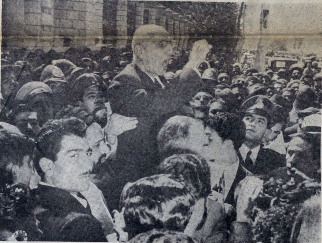
از گفتار امام خمینی در دیدار با افراد ارتش جمهوری اسلامی

روز ۲۹ خرداد مصادف است با روز درگذشت مرحوم سید اسداله رسا مدیر روزنامه قانون. رسا چنانچه در اتوبیوگرافی ایشان که در همین شماره میخوانید از بیست سالگی بصف احرار ایران پیوست و پس از مشارکت در مبارزات ضد قرارداد و سلطنت رضاخان مدتها در زندان و تبعید بسر برد و پس از آن در صف ملازمان دکتر مصدق قرار گرفت. تا روز ۲۸ مرداد که خانه اش را غارت کردند. در این دوره هم رسا مشی مردمی را رها نکرد و همهجا در پیشاپیش روزنامه نگاران ملی برای آزادی مبارزه کرد و در این دوره است که لحظه ای از یاد پیشوای ملت دکتر محمد مصدق فارغ نبوده است. ما بمناسبت هفتمین سال درگذشتش بانتشار یادنامه این مجاهد دیرپای آزادی که مخصوصاً آزادی قلم مرارتها برد مبادرت میوزیم و از خانم رسا همشیره ایشان که قسمتی از نوشته های آن مرحوم را به پرخاش سپرده اند سپاسگزاریم باشد که با این تذکار جبران فشار حکومت طاغوت را کرده باشیم که نگذاشت برای بزرگداشتش حتی آگهی ختمی هم منتشر کنیم - رسا نویسنده ای توانا - مسلمانی متدین آزاده ای ایران پرست - شاعری بی تکلف بود. روانش شاد باد. رسا در طول حیات خود همیشه همگام روزنامه نگاران ملی بود.