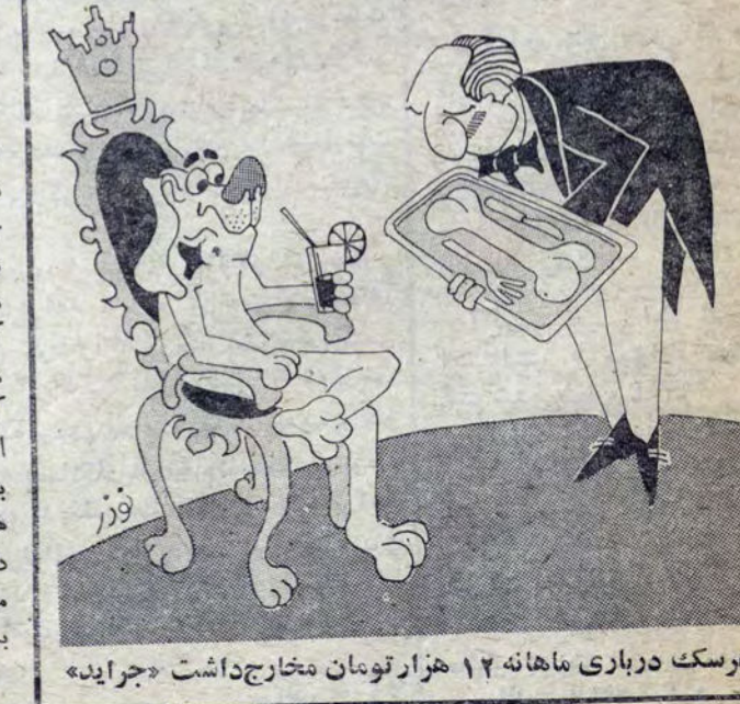
هرسک درباری ماهانه ۱۲ هزار تومان متخارج داشت «جراید»

«خبرنگاران مجله امریکائی» «تایم بدقت مسئله دانشجویان ایرانی مقیم امریکا را که» «بالغ بر پنجاه هزار نفر میشوند» «و بزرگترین واحد دانشجویی» «غیر امریکائی در ایالات متحده» «میباشند بررسی و با عنوان» «کردن مشکلات و بزرگ کردن» «گرفتاریهای دانشجویان ایرانی» «دست بحریک زده اند. ما» «ترجمه این مقاله را با حذف» «برخی جملات تند و با نظری» «مساعد از نظری خوانندگان» «پرخاش میکذاریم و امیدواریم» بقیه در صفحه ۶