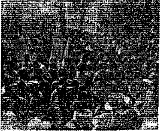
هزاران هزار از افراد حزب ما در اصلهان در هدایت و رهبری مردم برای صندوق ها نقش فعالانه ای داشتند و با کوشش آنان اصحاب بانگاه نهضت ملی تهران شناخته شد.

نخست وزیر تقاضای صدور فرمان انتخابات دوره هیجدهم را نمود بیلانوشتم که آقای دکتر مصدق برای اعلام انعزال مجلس شورای ملی صدور فرمان انتخابات را از شاه خواهد خواست و باستاناد فرمان انتخابات دوره هیجدهم انعزال مجلس را اعلام خواهد نمود بدین منظور دیروز نامه ای از طرف بقیه در صحنه!