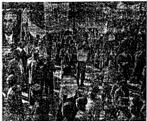
مقدم صفوی يك واحد از ارتش زحمتگشان اصلهان برای تحکیم حکومت مصدق و شرکت در فرماندوم وارد میدان نقش جهان میشوند

مصدق پیروز است انکار ترغیب و امانه و ایدآل های ملی مردم کشور مانند سیل خروشان که در زمین نشسته جریان داشته باشد در نارو بود منزهای مردم نفوذ پیدای کند مردم از دست رفته خود آشناسده و وحدت و هم آهنگی بی سابقه در انکار و امان مردم کشور ایجاد دیگر دو یگانگی پرستانی که بقیه در صحنه!