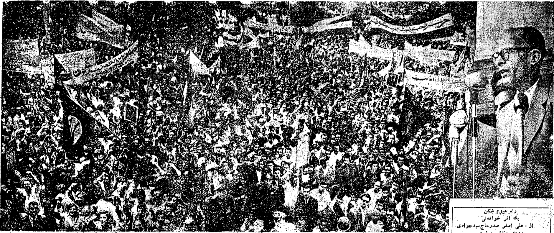
راه پیروز شیکن یک اثر خوانندگی از: علی امیر صدر حاج سیدجوادی بزودی منتشر میشود

بیش از دهها هزار نفر از مردم تهران مبارزه مصدق را تایید میکنند تا چشم دشمنان ملت کور شود