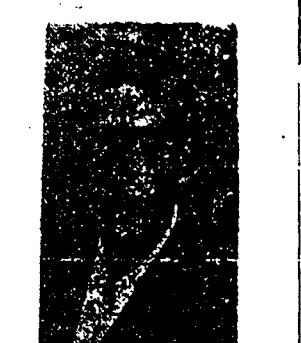
اینجا بنحسمن خبری دانش آموزان (مرد) دبیرستان اقبال دارای شناسنامه شماره ۴۹۸۸۸۴۴۴ متعلقه سال برای حزب توده فعالیت بقیه در صحنه

چرا افحش میدهند؟ آیا افحش در قبال حمله منطقی یا لا اقل در قبال ادعا علامت ضعف نیست؟ ممكن است در آنچه که مینویسم احتیاط کرده باشم در آن صورت من از رفتن هرگز حزب توده میخواهم برای هدایت من و افراد ساده حربما اگر کم نتوانستند نظریات خود را در روزنامه های خویش منتشر کنند لا اقل با ما تماس بیشتری بگیرند -