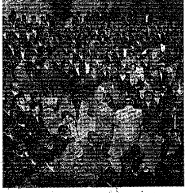
جمعیتی که در سیاحت بطق ملکی گوش میدهد