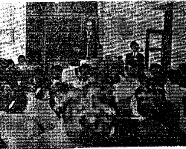
از سخنرانی آقای ملکی در سالن حزب زحمتگشان دو شنبه ۴ - خرداد

بعد از جنگ بین المللی اول چکسلواکی یکی از پربلندترین و بارورترین دموکراسی های اروپا بود؛ یک سیستم ترکیب اقتصادی کاملاً متعادل و همچنین دستگاه زراعتی کاملاً متشکل با دستگاه صنعتی فوق العاده توسعه یافته کشور ترکیب اساسی اقتصاد ملی چکسلواکی را میدادند. اختلالات طبقاتی بین سکنه کشور خیلی محسوس نبود، رفورم زراعتی در چکسلواکی بقدر قابل ملاحظه ای خورده مالکین و دهقانان را در برداشت محصول تقویت کرده و بر اساس همین تقویت و کوشش های این عناصر بهره برداری از زمین بیزاران فوق العاده ای افزایش یافت یک قانونگزاری اجتماعی مترقی شرایط زندگی کارگران و کارمندان را تعیین نموده بود و تقویت مالی کشور محسوساً بواسطه موفقیت چترائیاتی کشور که در قالب اروپا قرار دارد، از هر جهت رضایت بخش بود، پراک شهری که در او راهش بر روی هر طرف تنگ و چریانات فکری و سیاسی باز بود تبدیل بیک مرکز روشنفکری و هنری و محیط کاملاً زنده ای در آمده بود. در مدت پانزده سال این جمهوری جوان بوسیله یک دیپلمات شرافتمند و دانشمند و کاملاً مترقی که در بالاترین درجه اخلاق و حکمت قرار داشت اداره میشد ت.ز. مازاریک با اتفاق ادوات بنش همکار صمیمی و باوقاش توانمند سیاست بنده در صفحه ۴