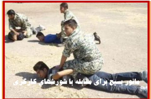
مانور بسیج برای مشابه با شورهای کارگری

روز سه شنبه ۶ بهمن ماه، حدود ۲۸ نفر از کارگران مجتمع مس خاتون آباد استان کرمان به دلیل شرکت در تجمعات صنفی که از مدتی پیش در اعتراض به اخراج و بیکار شدن کارگران برپا شده بود بازداشت شدند. تجمعات اعتراضی کارگران، پس از آن بر پا شد که مدیریت مجتمع مس خاتون آباد خبر اخراج کارگرانی که در آزمون تبدیل وضعیت استخدامی امسال موفق نشده بودند را اعلام کرد. علت اعتراض کارگران اخراجی این بود که مسئولین شرکت علیرغم اینکه در ابتدای کار این پروژه قول داده بودند که همه کارگران را استخدام کنند و برغم اینکه قبلاً شورای تامین شهرستان تصمیم گرفته بود که هیچ کارگر شرکت مس نباید اخراج شود اما آنها با برپائی یک آزمون ۱۳۰ کارگر را به بهانه اینکه در آزمون موفق نبوده اند از کار بیکار کردند. به دنبال این ترفند ریاکارانه کارگران اخراجی به اعتراض برخاسته و دست به تجمع زدند. در این گزارش در ادامه آمده است که معاون ذوب و پالایشگاه مس خاتون آباد نیز در خصوص وضعیت پیش آمده به رسانه های محلی گفته است: "سه هفته است که ما شاهد تجمعات و اعتراضات از سوی افرادی که در آزمون، حد نصاب نمرات را کسب نکرده اند هستیم، که خانواده های این افراد نیز آنان را همراهی می کنند و عملاً اجازه فعالیت را از کارگران و پرسنل گرفته اند و ما را در شرایط سخت کاری قرار داده اند." روز سه شنبه ۱۳ بهمن ماه، از مجتمع مس خاتون آباد خبر رسید که علیرغم گذشت هفت روز از بازداشت ۲۸ کارگر این کارخانه آنها آزاد نشده و از اولین شب بازداشت به زندان شهر بابک منتقل شده اند. بر اساس این گزارش تا این تاریخ هیچ پاسخ مشخصی در رابطه با نوع اتهامات وارده و روند پرونده قضایی این کارگران به خانواده های آنها داده نشده است.