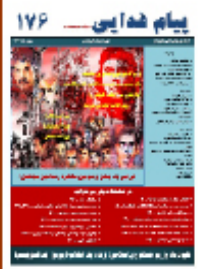
پیام فدائی شماره ۱۷۶ - بهمن ماه ۱۳۹۲