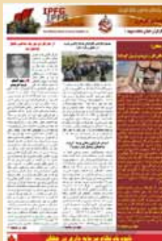
ماهنامه کارگری شماره ۲ اسفند ۱۳۹۲