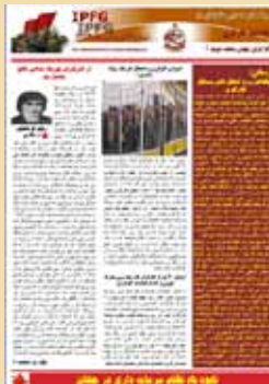
ماهنامه کارگری شماره ۳ فروردین ۱۳۹۳