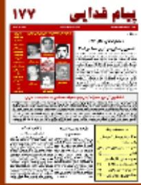
پیام فدائی شماره ۱۷۷ - اسفند ماه ۱۳۹۲