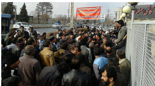
دوروز متوالی تجمع اعتراضی کارگران کاشی اصفهان برای اعتراض به عدم پرداخت يك سال از حقوق و مطالبات شان

در پلاسکو روی داد. وزارت کار جمهوری اسلامی از کارگران زبان دیده این مرکز تجاری خواسته است که برای "بیمه بیکاری" ثبت نام کنند. تا در صورت داشتن "شرایط دریافت استفاده از خدمات صندوق بیمه بیکاری" ظرف يك هفته "بیمه بیکاری" برایشان مقرر شود. بر همگان روشن است که آنجیزی که به آن بیمه بیکاری میگویند، با مبلغ ناچیز و مدت محدود و هزار اما و اگرش شامل بسیاری از این جمعیت هزاران نفره که از کار بیکار شده و هست و نیستشان را از دست داده اند، نخواهد شد. این را خودشان نیز اذعان کرده اند. این هیاهو را به راه