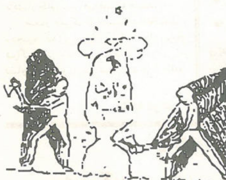
۳. هیئت، ای (دین فقه)

خط امام دانشگاه تبریز» با انتشار بیانیه ای سخنرانی الله کرم را «تأسف آور، ظاهر فریبی، تملق و نفاق خواندند».