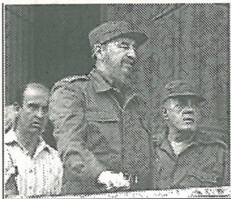
فیدل کاسترو دشمنی پیگیر آمریکا را که موجب ۲۰ مورد خرابکاری های اخیر بوده است محکوم نمود و یک گروه کوبایی های ضد انقلابی را که در میامی پایگاه دارند مسؤل بمب گذاری های پنج ماه

کنگره پنجم حزب کمونیست کوبا در سی امین سالگرد قتل چه گوارا، در ۱۶ مهرماه، در هاوانا افتتاح گردید. در سخنرانی افتتاحیه کنگره فیدل کاسترو، رهبر انقلابی کوبا، تعهد خود را به سوسیالیسم و ادامه سیاست هایی که بهبود اقتصاد کشور بدانها وابسته است، علی رغم تحریم اقتصادی خفه کننده و تنگ شونده ایالات متحده، اعلام نمود.