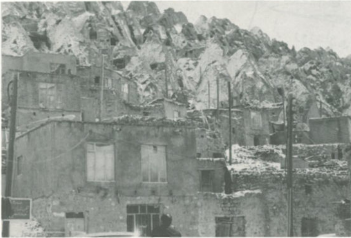
عکسی از زندگی غار نشینی در منطقه کندوان - آذربایجان شرقی

فقر سیاه که نتیجه مستقیم سیاست های ضد مردمی رژیم است، صدها هزار انسان در جنگل ها، غار ها، مخروبه ها و حلبسی آباد ها زندگی می کنند، و هیچگونه چشم اندازی به آینده ای روشن را پیش رو نمی بینند.