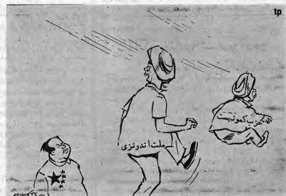
ملتا اندونزی بماتو ته توک ، اکنون می توان روابدا عادی کرد