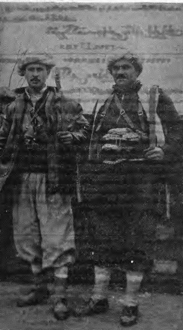
نه بمبهای آتش زنا و نه نمازهای سمی، هیچکدام قادر نیستند که این پیش مرگان بر زمین نژاد کوه پیکر ما را از نبرد علیه اهریمنان و دشمنان دیو خوی آئین و فرهنگ ایران زمین بازدارد

برای آگاهی بر نظریات حزب پان ایرانیست در مورد: ۱- سیاست ملی ایران در خلیج فارس ۲- مفهوم « ملی شدن صنایع نفت در سراسر ایران» ۳- وظائف ملت، دولت و سازمانهای اجتماعی ایران - نسبت به حوادث غرب «ایران زمین». ساعت شش و نیم عصر روز امروز کنفرانس سیاسی و مطبوعاتی حزب پان ایرانیست بر گزار خواهد شد، از آرمانخواهان ایران زمین و هواداران «خاک و خون» دعوت بحضور در این کنفرانس میگردد. دفتر سیاسی حزب پان ایرانیست نشانی: میدان بهارستان - شماره ۴ - دفتر «خاک و خون»