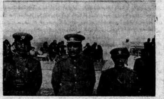
از چپ بر است ژنرال لوائی، ژنرال گویان و ژنرال عظیمی