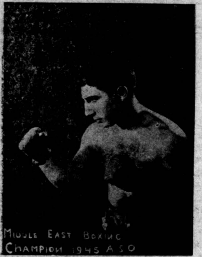
میکس فوق بناسبت مسابقه بوکس شرمقهر از فورا برداشته که در آن بر چند نیرمان آوکراینی و خاور بیانه لائق آمد و لفظ از یکی از مشاهیر آنها شکست خوردده است. بربروز نیز فورا دو امجد به بر سر قاپ خود کاروسی لائق آمد و نیرمان مسلم ایران شناخته شد. در حالیکه وضعیت زده گی او بسیار بد است و امیدواریم که دستنگاه تربیت بدنی ایران از قهرمان لائق نهایت تقویق و استفاده را بکنند.

قهرمان اول بوکس اوکراین : نیرمان دوم بوکس اتحاد شوروی و عضو کمیسیون ورزشی حزب توده ایران بر سر قاپ لائق آمد ما برین قاپی خود از صمیم قلب تبریک میگوییم