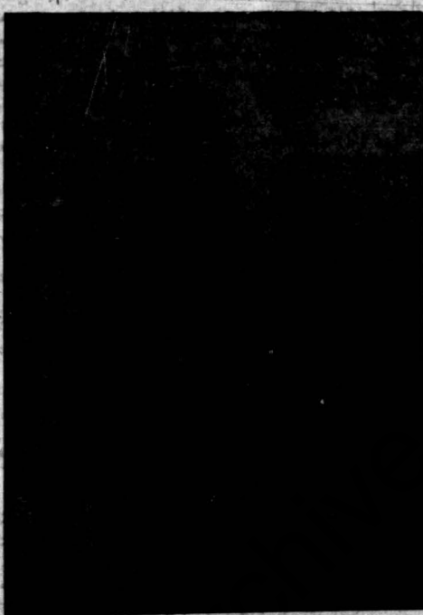
هادروان باقرخان سردار ملی از بزرگترین مردان مبارز جنبش مشروطیت ایران