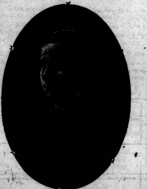
شادروان باسکرویل پیش از آزادی بهران ایران در این جوان یک نهاد امریکایی چنان مقرر شد که خود را در راه آزادی ایران نهاد نماید