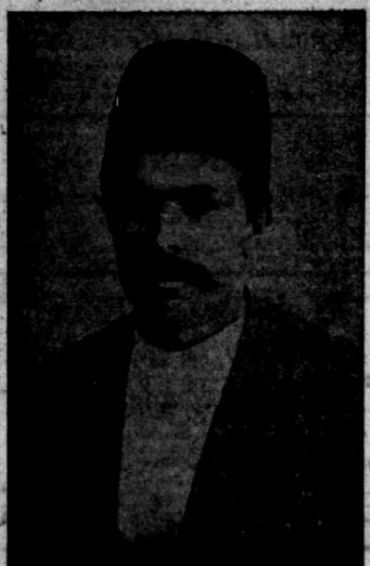
هادروان میرزا جهانگیرخان صور اسرائیل یکی از نویسنده گان بزرگ و مبارز راه آزادی که در باغشاه کشته شد

این مرد بزرگ یکی از بنیاد گزاران مشروطه ایران است و کوششهای هادروان فرا وش نشانی است