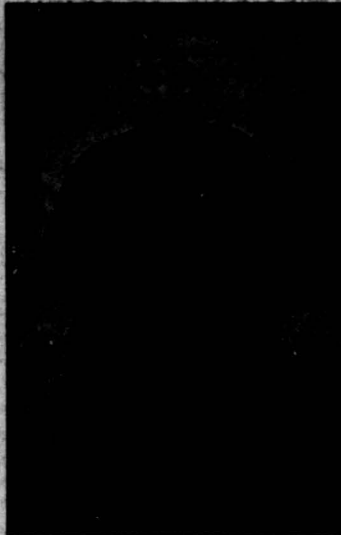
شادروان مالك المتكلمين

یکی از نامتقن بزرگ مشروطیت که در باغشاه کشته شد