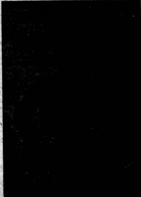
هادروان باقرخان سالار ملی یکی از مردان بزرگ انقلاب مشروطیت ایران که از میان توده انبوه مردم برخاسته بود

روز ۱۴ مرداد ۱۳۳۵ درست چهل سال تمام از روز زردگی ۱۴۴ اجتماع عقب مانده ایران وارد مرحله جدید تاریخ خویش گشت میگذرد و اکنون تمام ایرانیان میهن دوست و آزادیخواه آغاز چهل و یکمین سال پیروزی مشروطیت را در وطن تاریخی خود جشن میگیرند . ملت دلیر ما که بارها طی تاریخ پر افتخار خود تنفر شدید خویش را از زور و ظلمی مرتجعین و مستبدین خونخوار به ثروت رسانیده ملتی که بایکار بردن هوش و استعدادی نظیر خود همیشه زسی کرده است دوش بدوش دنیای مترقی و ایثار جوان جلو برود مسلماً نمیتوانست در برابر نسیم فرح بخش و روح پرور آزادی که از سال ۱۷۸۹ ( انقلاب کبیر فرانسه ) تا ۱۹۰۵ ( انقلاب روسیه ) سر زمین های اروپا و آسیا را مسطر کرده بود سد سدی تشکیل دهد .