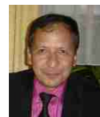
بهروز مهر آبادی

اینگونه اخبار را فقط می توان در جمهوری اسلامی شنید: وزارت امور خارجه به شهردار پایتخت اجازه خروج از کشور نداد! در مراسم توزیع جایزه ای به شهر تهران که آنهم داستان خود را دارد، علیرضا دبیر عضو هیئت رئیسه شورای اسلامی تهران به نمایندگی از شهرداری تهران حضور داشت. سردار محمد قالیباف شهردار کنونی تهران در جرگه نزدیکترین یاران و مورد اعتمادترین کارگزاران جمهوری اسلامی بوده است. وی مدتها از فرماندهان سپاه بود که بدستور خامنه ای به فرماندهی نیروی هوایی سپاه منصوب شد و مدتی هم فرمانده نیروهای انتظامی را بعهده داشت و در واکنش به اعتراضات دانشجویان در ۱۸ تیر به اتفاق تعدادی دیگر از فرماندهان سپاه به محمد خاتمی رئیس جمهور وقت نامه نوشت و خواستار برخورد قاطع با مخالفان ولایت فقیه شد. و اکنون جالب و قابل توجه است که همین ایشان، یعنی همین خادم قدیمی حکومت اسلامی اجازه نیافتند است به خارج از ایران سفر کنند. از همین جا میتوان اوضاع جمهوری اسلامی را سنجید و ارزیابی کرد. این حکومت کارش به جایی رسیده است که به یاران نزدیک خود نیز اعتماد ندارد. اگر رژیم انسجام داشت بدون شک از این جایزه بعنوان یک ابزار تبلیغاتی برای خود استفاده می کرد اما از نظر احمدی نژاد و خامنه ای هیچ تضمینی وجود ندارد که حتی جناب قالیباف خارج از ایران و دور از گزند برادران حکومتی اش، در جایی اعلام پناهندگی کند. و شروع به افشا کردن حسابهای بانکی سران حکومت و اسرار پشت پرده حکومتیان بنماید.