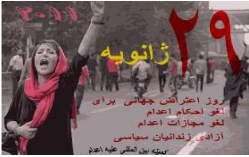
به اطلاع خواهد رسید. بیمارستان تیراوه