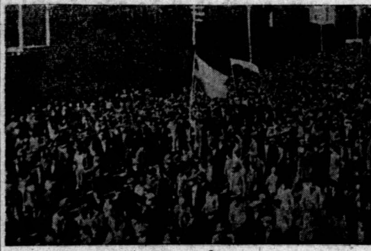
میتنک پس از تظلمهای پرشور رهبران حزبی و مراجعت بکوب در ساعت ۶ بعد از خانه یافت کلیه بالا یک منظره از میتنک را نشان میدهد

روز جمعه ۲۶ بهمن بنمایش آزادی احزاب میتنک باشکوهی در کرساتشاه داده شد. در این میتنک ۱۴ هزار نفر از کارگران و دهقانان متشکل و سازمان جوانان شرکت کرده طول میتنک بالغ بر یک کیلومتر بود.