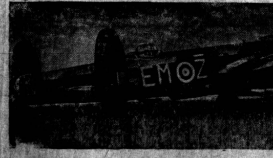
یک نمونه از طیارات چهار موتوری انگلستان

دو دوی هواپیما بر فراز در توند دود و آتش تا پانزده هزار پا زبانه میکشید دومین حمله در یکماه دیشب هواپیماهای متفقین بر دور توند حمله شدیه و بی نظیری نمودند. این دومین حمله بود که در ماه مه بر این شهر انجام گرفت در نیه اول سه هواپیما بکبار بمب افکن های انگلیسی بر آن حمله ور گردیدند و شدیداً آتراج آماج بیهیای خویش قرار دادند. سپس در اثر شکست شدن سه «مومن» و طغیان رود خانه «رور» باین شهر و کارخانه ها و ساختمان های آن خسارات فراوان وارد آمد. هنوز خرابیهای سیل و طغیان آب ترمیم نگردیده بود که بر پیش برای دومین بار بپروقت آن رفته هر بلای میخواستند بروز او آوردند. شماره بمب افکنهایی که در این بمباران شرکت داشته قریب بهزار بوده است و عموماً از بمب افکنهای چهار موتوره بوده که هر یک در حقیقت غول برنده است و تعداد کارکنان آن از پنجاه تن تجاوز است بدیهی است هرگاه هزار عدد از این هواپیما ها بر قطعه حله و رفته چه بروز کار آن خواهند آورد این هواپیما ها بیش از ۲۰۰۰ تن (در حدود شش هزار خروار) بمب بر شهر نابریه ریخته اند در اثر آن بقی