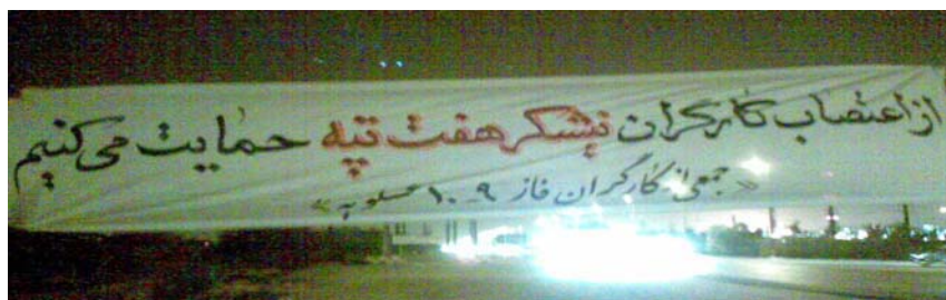
ابتکار کارگران عسلویه در حمایت از کارگران نیشکر هفت تپه زنده باد اتحاد کارگران علیه سرمایه داران