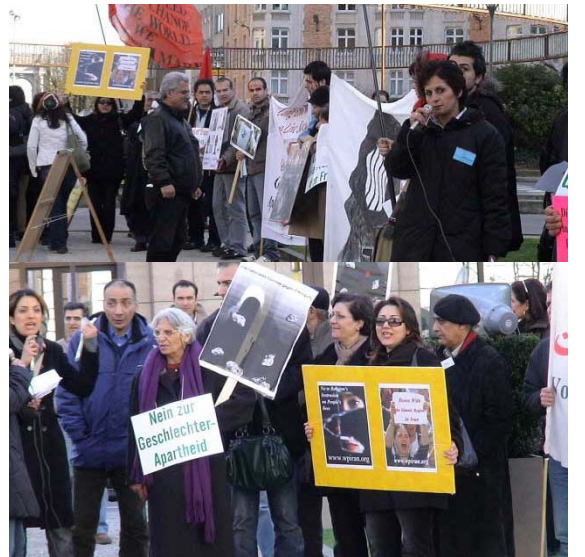
تظاهرات در مقابل مقر پارلمان اروپا

گسترده و اجتماعی بر علیه حجاب، در مورد نقش حجاب اسلامی و جایگاه آن برای جنبش اسلام سیاسی و همچنین حجاب کودکان و همچنین در مورد احکام اعدام در ایران و بویژه حکم اعدام دلارا دارابی گفتگو کردند. در پایان این مذاکره تصمیم گرفته شد که در پارلمان اروپا بزودی یک کنفرانس در مورد حجاب اسلامی برگزار شود و از فعالین