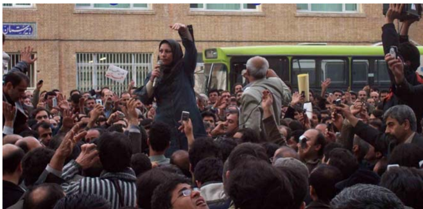
گوشه ای از تظاهرات گسترده معلمان در مقابل مجلس اسلامی