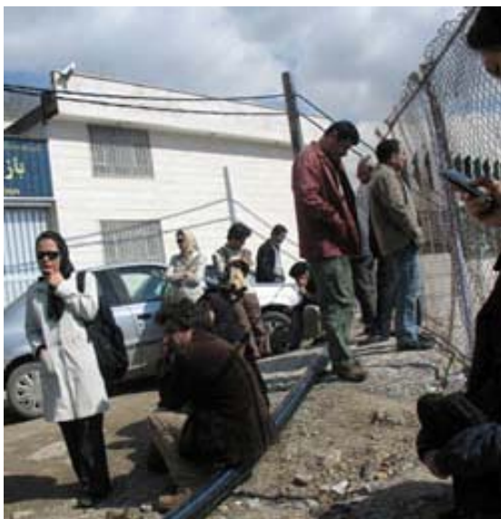
تجمع اعتراضی در مقابل زندان اوین

میز اطلاعاتی و نمایش خیابانی با استقبال روبرو شد شنبه سوم مارس از طرف واحد حزب کمونیست کارگری ایران در نروژ در شهر اسلو، میز اطلاعاتی و