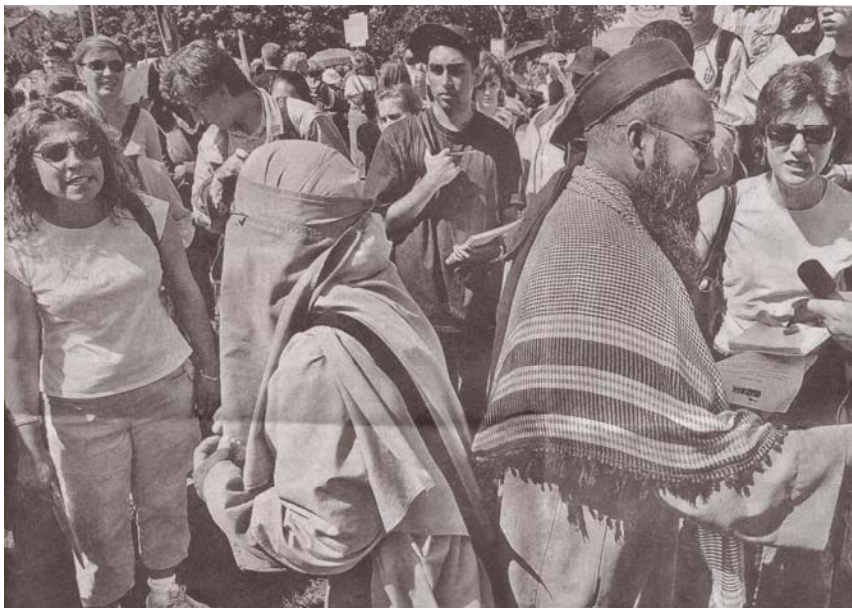
این گوشه ای از تظاهرات جهانی کمپین علیه ایجاد دادگاههای شرع در کانادا (تورنتو) در ۸ سپتامبر است. در این تصویر دو مدافع سرسخت استقرار شرع اسلامی در کانادا در محاصره مردم خشمگین مدافع کوتاه کردن دست مذهب از زندگی مردم هستند.

از پروفیسورها و انتلکتوئل های کم عقل و فمینیست های متاثر از دنیای پس از جنگ سرد به مبلغان آن تبدیل شدند. این مجموعه دست به دست هم داد و عقبگردی همه جانبه به جامعه بشری توسط این خیل سیاستمداران و متفکرین و روشنفکران طبقه حاکم تحمیل شد. این دوده برآستی دوره عقبگرد بشریت بود. در چنین شرایطی پیروزی کمپین علیه شریعه در کانادا بر عنوان یک