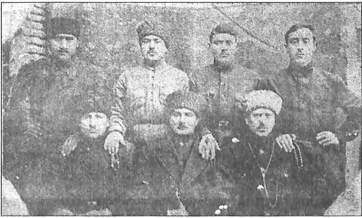
شامیل جوانشیر با عده‌ای از پارتیزانهای قفقازی که پس از جنگ با بلشویک‌ها به ایران فرار کردند. این عده به غیر از جوانشیر اکنون در ترکیه زندگی می‌کنند.