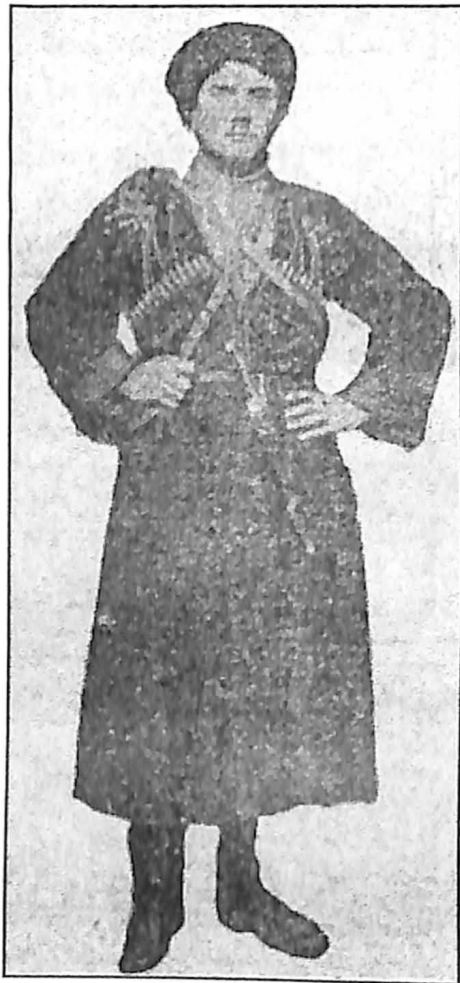
پولاد بالاگده رئیس دسته پارتیزانی قفقاز