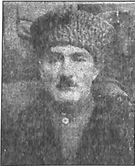
جوانشیر در لباس قفقازی