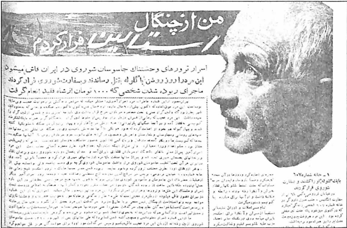
نمونه‌ای از خاطرات جوانشیر در هفته‌نامه تهران مصور