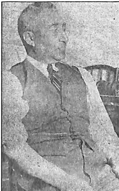
حسین‌زاده معاون وزارت بازرگانی جمهوری آذربایجان که توسط سربازان ارتش سرخ با مسلسل از پای درآمد.