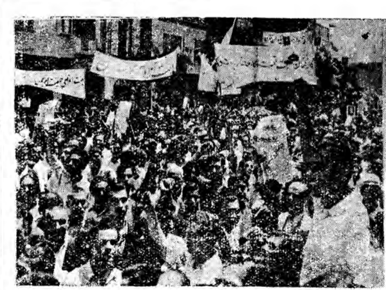
گوشه ای دیگر از میتینگ پرشکوه ملیون تهران در صبح ۳۰ تیر

سازمان بر نامه پاسخ میدهد اداره روزنامه مردم ایران عطف با اخبار مندرج در شماره های ۳۲ و ۳۸ تحت عنوان ( قابل توجه با زوسی کل نهضت و زبری و مدیر عامل سازمان برنامه و مدیر عامل شرکت پنبه و یک خبر کوچک دیگری راجع به شرکت پنبه ) اشعار میآورد که مراتب مورد بررسی واقع بقیه در صحنه ۲