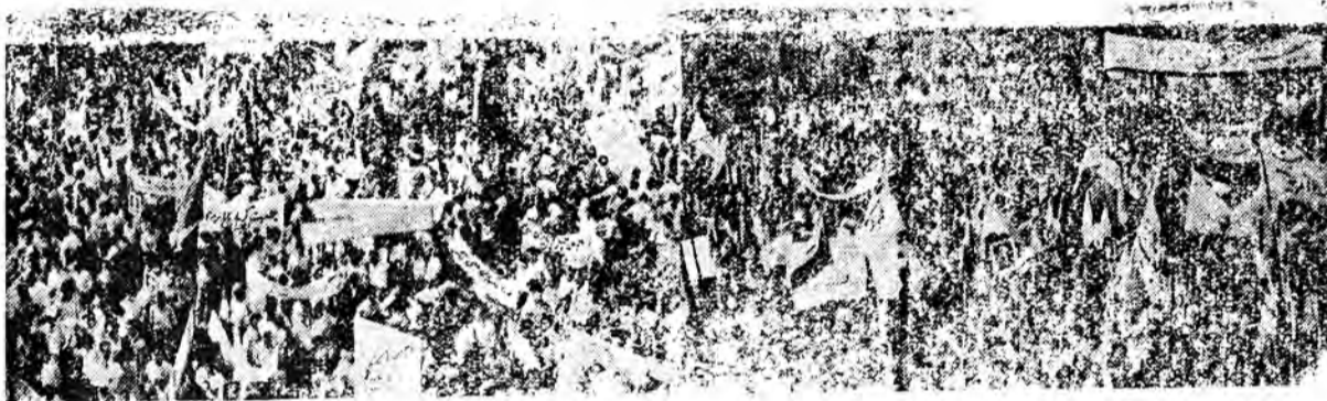
گوشه ای از تظاهرات عظیم مردم تهران در صبح روز تاریخ ۳۰ تیر ماه

تا در میدان بهارستان قتلگاه شهیدان را، آزادی، آنجا که قدرت های پوشالی در برابر قدرت واقعی ملت تهران ما سر فرو آورده و سجده کرده بودند بیوندناگستی خود را با قهرمان پر افتخار وطن دک مصدق تجدید کنند.